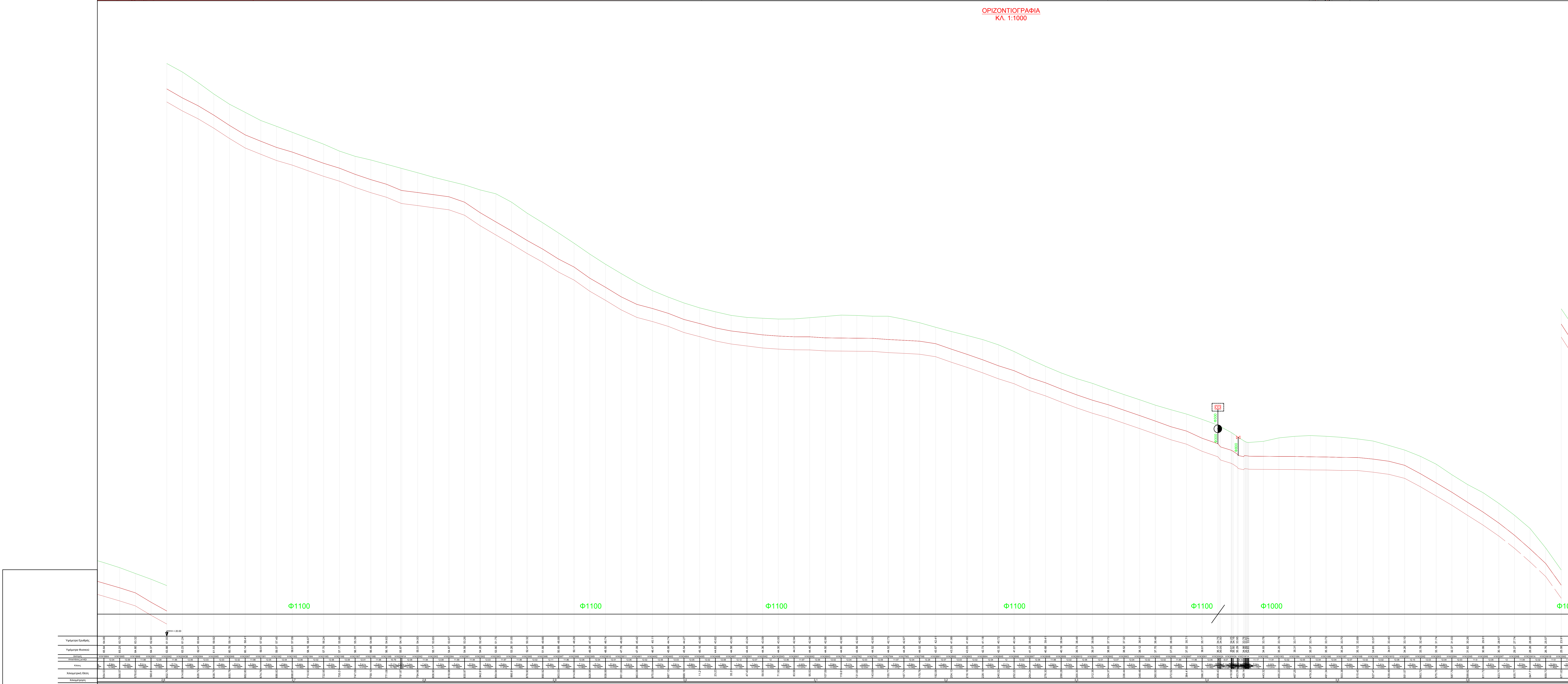
ΚΑΤΑ ΜΗΚΟΣ ΤΟΜΗ ΚΑΛ. 1:1000 / 1:100

ΑΓΩΓΟΣ ΥΔΡΕΥΣΗΣ ΚΑΤΑΒΕΒΛΩΜΕΝΟΣ ΑΓΩΓΟΣ ΥΔΡΕΥΣΗΣ